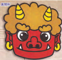
(P.86) 086GS7-0004 節分-鬼面(特大)