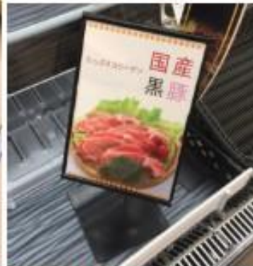
カードスタンド取り付け(ブラック)