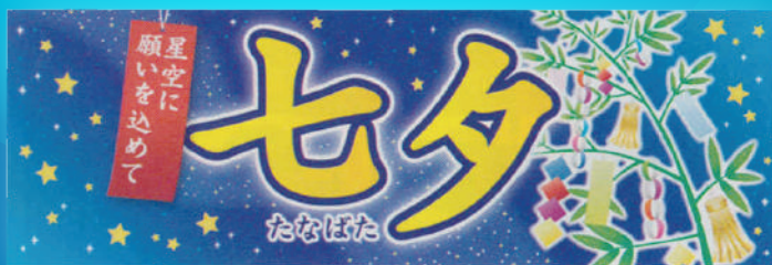
●バラポスター 1パック(10枚入) 両面 30×90cm

空いた壁や柱を使って店内のデッドスペースを有効に生かします。ポスターは、連続して展開できるデザインになっています。