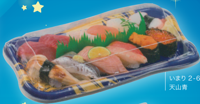
いまり 2-6 天山青