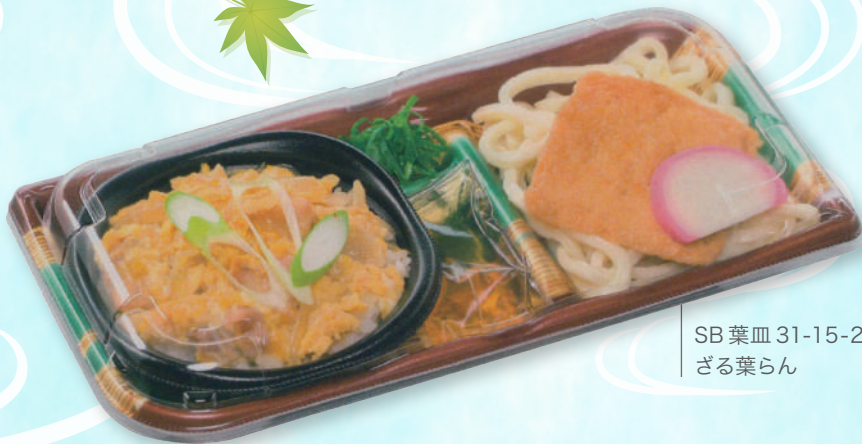
SB葉皿 31-15-2 ざる葉らん