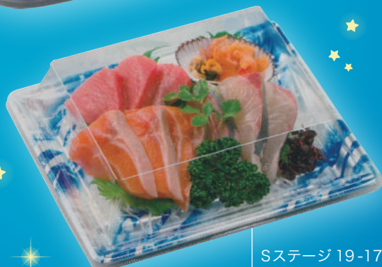
Sステージ 19-17 冷氷青