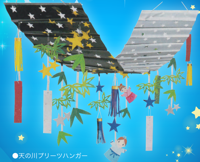
●天の川ブリーツハンガー H45×W45×L180cm

笹を飾る場所がなくても、 小スペースで七夕を盛り上げます！ イベント後の片付けもカンタン！