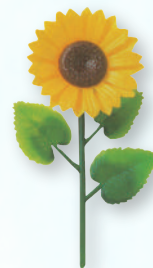
●A-45 ヒマワリ (50×6箱×10箱)