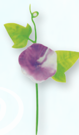
●A-42 朝顔 紫ツートン (100×6袋×10箱)