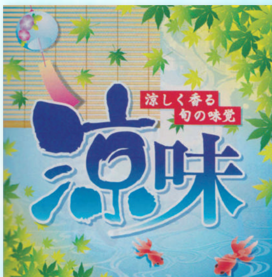
●涼味 (金魚) テーマポスター 1パック (10枚入) 38×38cm