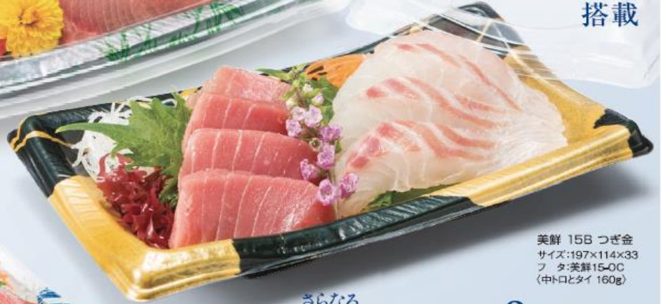
美鮮 15B つぎ金 サイズ:197×114×33 フタ:美鮮15-0C (中トロとタイ 160g)