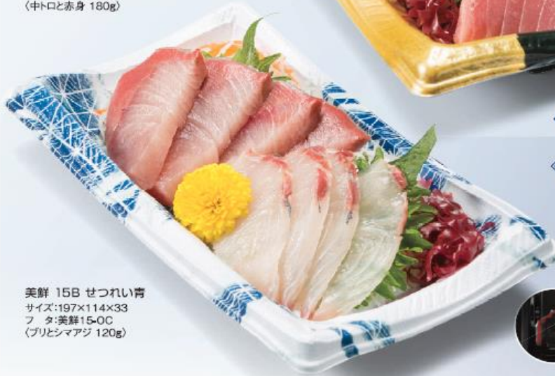
美鮮 15B せつれい青 サイズ:197×114×33 フタ:美鮮15-0C (ブリとシマアジ 120g)