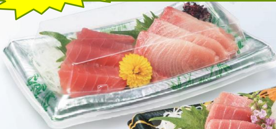
美鮮 15B こみち緑 サイズ:197×114×33 フタ:美鮮15-0C (中トロと赤身 180g)