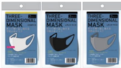
パッケージイメージ (若干変更になる場合がございます。)