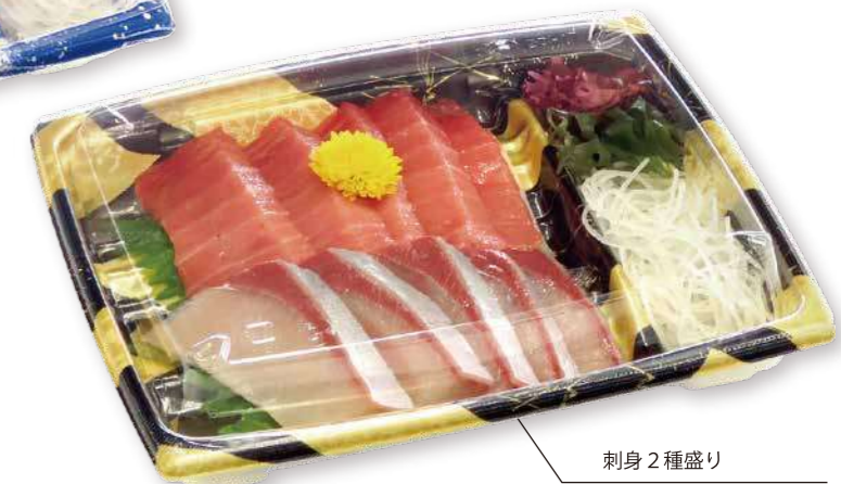
刺身2種盛り BCF 海帆 20-17 光舞 BK