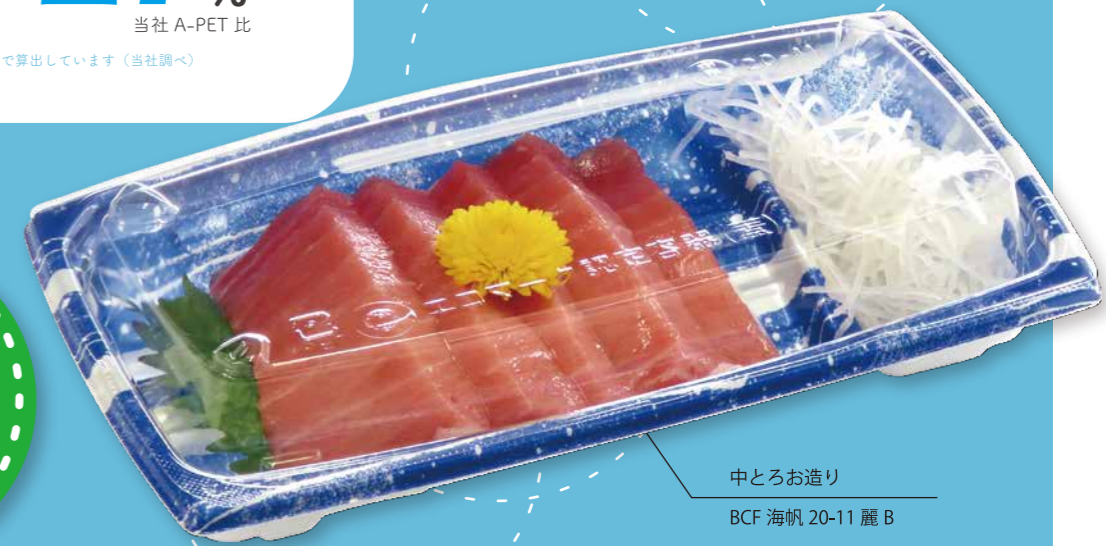
中とろお造り BCF 海帆 20-11 麗 B

バイオ CF は 植物由来プラスチックを 10% 使用した 環境配慮型製品です。