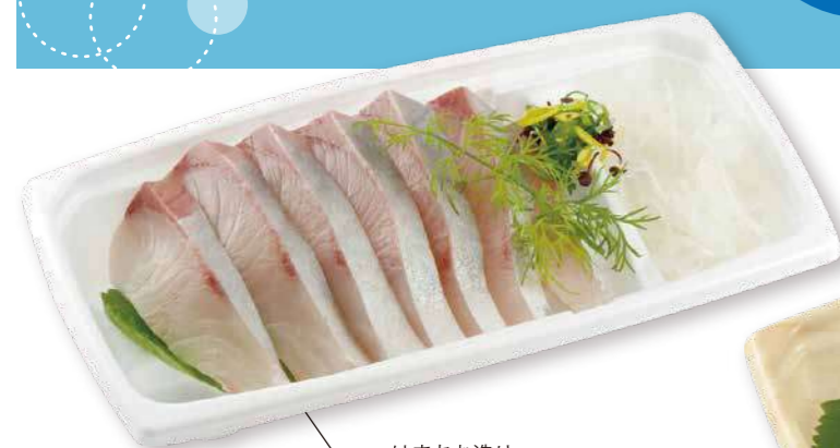
はまちお造り BCF 海帆 20-11