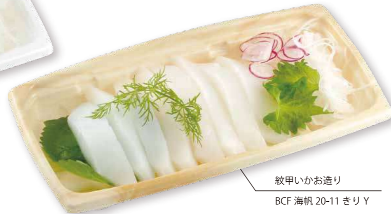
紋甲いかお造り BCF 海帆 20-11 きりY