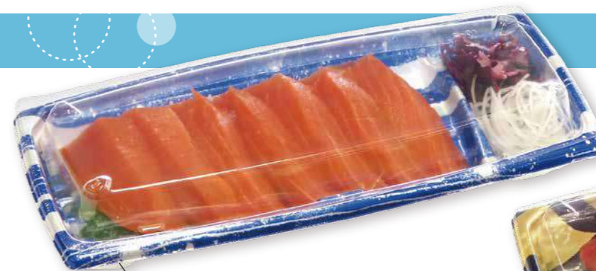
たっぷりサーモンお造り BCF 海帆 25-11 麗 B