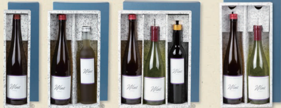
ロングワインギフト箱