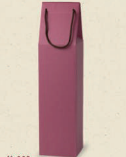
K-369 スパークリングワイン1本 手提箱