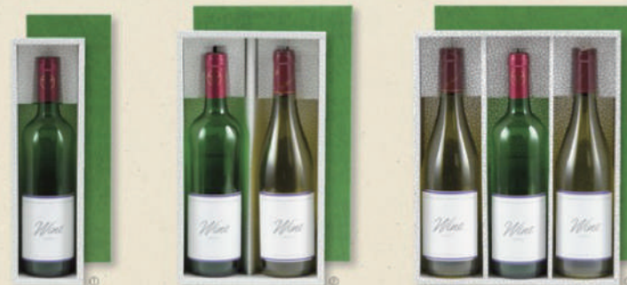
レギュラーワイン(お徳用)