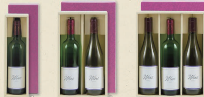
レギュラーワイン箱