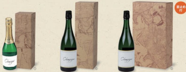
シャンパン筒式サービス箱