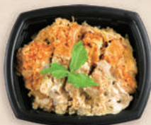
厚切りロースかつ丼 BCT コバコ 18-15 BK