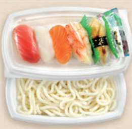
寿司うどん弁当 BCT コバコ 21-12 W/中皿