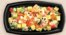
海鮮ちらし寿司 BCT コバコ 21-12 BK-コトン BR