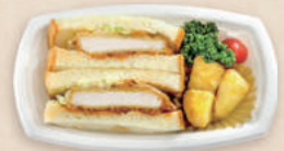
カツサンド BOX BCT コバコ 21-12 W