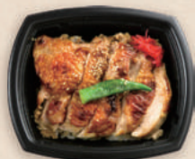
鶏照り焼き丼 BCT コバコ 18-15 BK-コトン BR