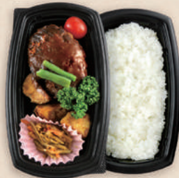
ハンバーグ弁当 BCT コバコ 21-12 BK/中皿