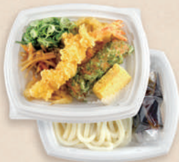
天ぷらうどん BCT コバコ 18-15 W/中皿