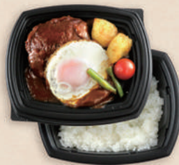
ロコモコ BCT コバコ 18-15 BK-コトン BR/中皿