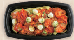
トマトソースパスタ BCT コバコ 21-12 BK