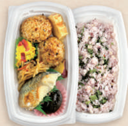
健康弁当 BCT コバコ 21-12 W-コトン P/中皿