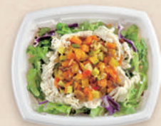
蒸し鶏の彩りサラダ BCT コバコ 18-15 W-コトン P