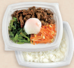
ビビンバ BCT コバコ 18-15 W-コトン BG/中皿