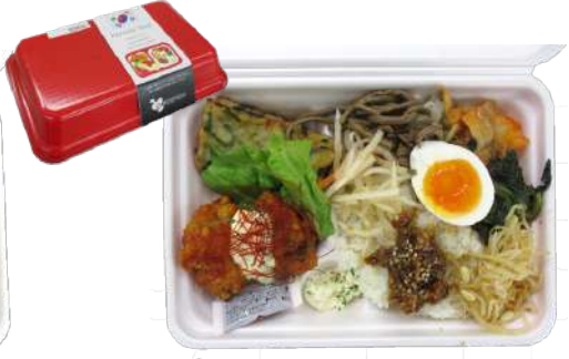
韓国風～世界の旅料理～ 本体832円 街デリ BOX25-16 赤