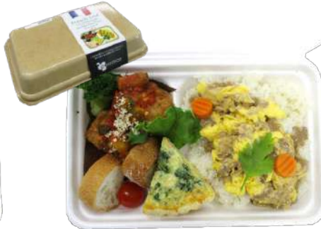
フランス風～世界の旅料理～ 本体832円 街デリ BOX25-16 クラフト