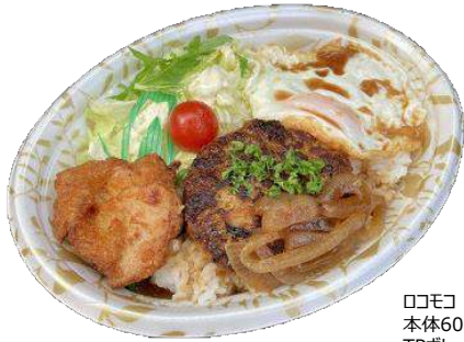
ココモ 本体600円 TPボレノ M24-18 アリアG