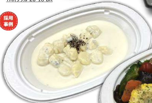
チーズニョッキ 本体498円 TA DINER M25-15 W