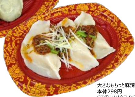
大きなもちっと麻辣水餃子 本体298円 CTグルメハウス D21 メイR