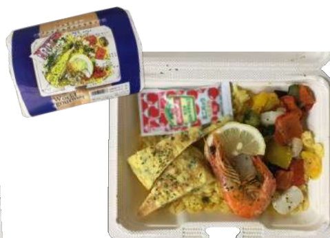
バエリアとスパニッシュオムレツランチ 本体498円 MPK街デリ BOX19-14 OW