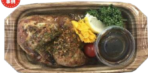
フリフリチキン風 本体780円 SDピストロ PAN25-13 さやY