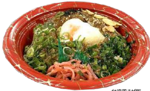
台湾風まぜ飯 CTいぶき丼 M17 きらR