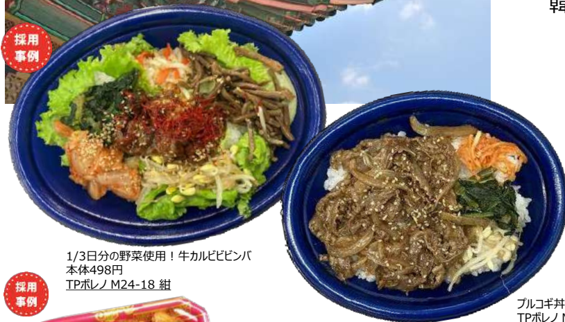
1/3日分の野菜使用！牛カルビビビンバ 本体498円 TPボレノ M24-18 紺