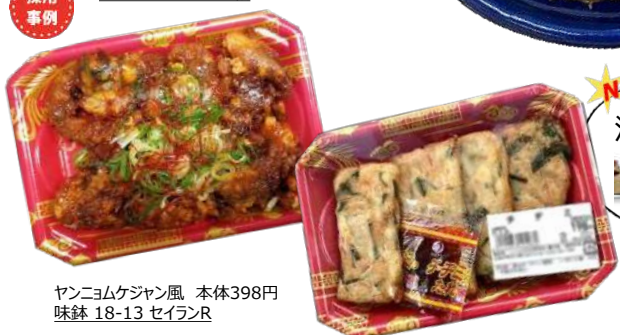
ヤンニョムケジャン風 本体398円 味鉢 18-13 セイランR