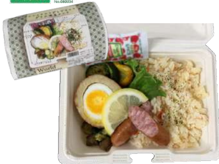
スコッチエッグとピラフのグリル野菜ランチ 本体458円 MPK街デリ BOX19-14 OW