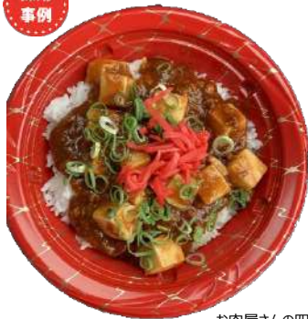
お肉屋さんの四川麻婆丼 本体398円 CTいぶき丼 M17 きらR