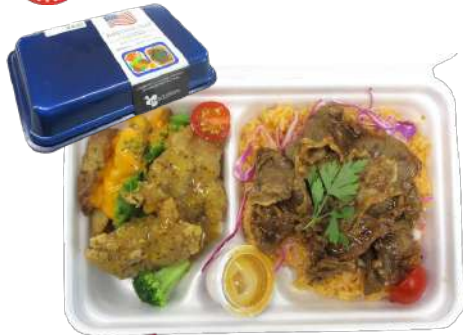
アメリカ風～世界の旅料理～ 本体832円 街デリ BOX25-16 紺