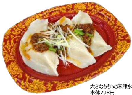
大きなもちっと麻辣水餃子 本体298円 CTグルメハウス D21 メイR