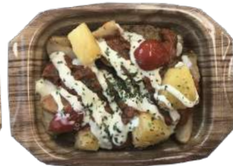
ポテチリビーンズ 本体498円 SDピストロ PAN18-13 さやY