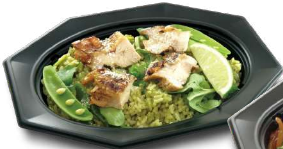
グリーンチキンパエリア TAオクタレ 26-18 BK