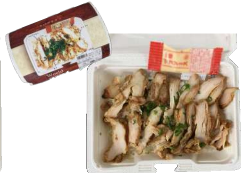
ケバブチキン丼 本体438円 MPK街デリ BOX19-14 OW

MAPKAは紙パウダーを主原料とするため、紙由来の品質特性があります。紙を混成させる都合上、表面に色ムラや白点・炭化した黒点が出る場合があります。