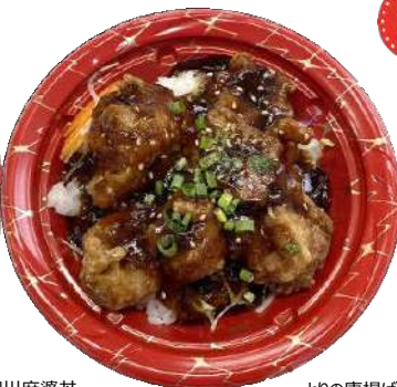
とりの唐揚げユーリンソース丼 本体463円 CTいぶき丼 M17 きらR