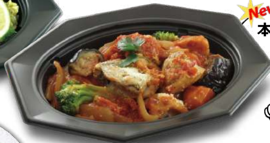
グリルチキンと5種野菜のトマト煮 TAオクタレ 23-17 BK