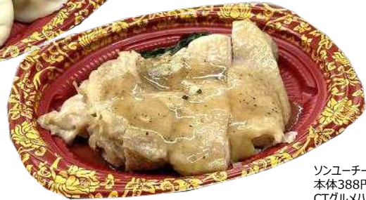
ソユーチー 本体388円 CTグルメハウス D21 メイR