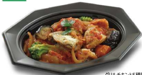
グリルチキンと5種野菜のトマト煮 TAオクトル 23-17 BK