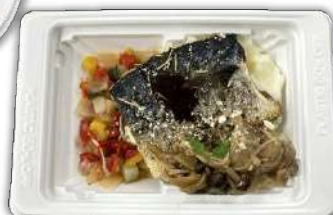
サバの香草焼き (バルサミコソース掛け) 本体398円 TA DINER K19-13 W