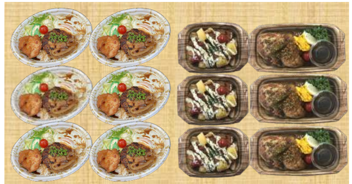
ロコモコ 本体600円 TPボレノ M24-18 アリアG