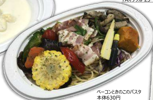
ベーコンときのこのパスタ 本体630円 TA DINER M25-15 W