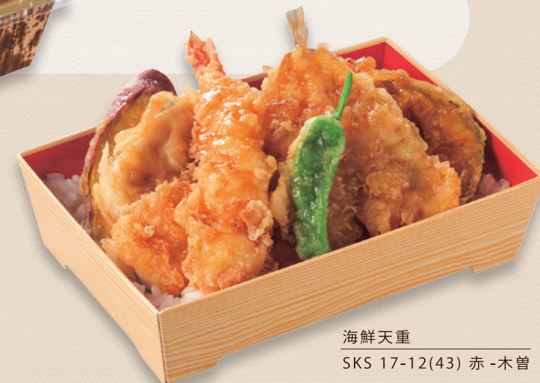
海鮮天重 SKS 17-12(43) 赤-木曾