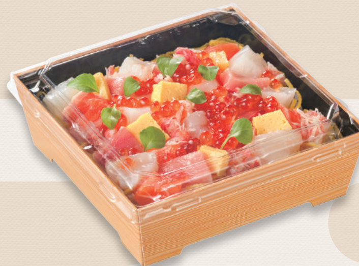
海鮮ちらし寿司 SKS 13-13(43) 黒-木曾 / 浅蓋