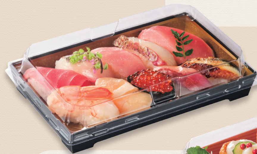
上にぎり寿司10貫 SKS 20-12 金箔-黒 / 蓋