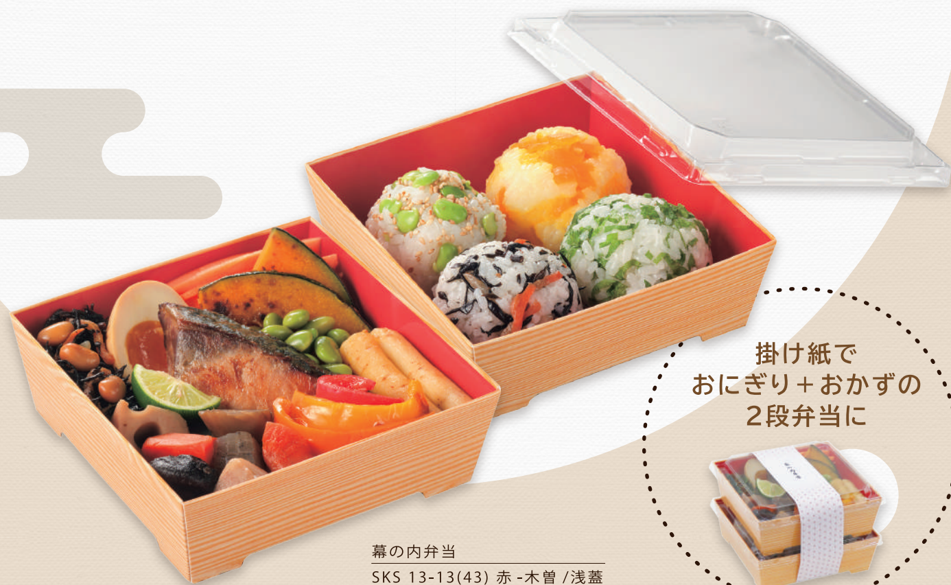
幕の内弁当 SKS 13-13(43) 赤-木曾 / 浅蓋