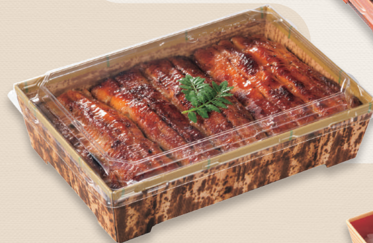
うな重 SKS 17-12(43) 竹皮 / 浅蓋