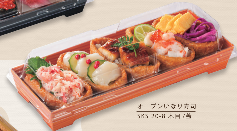
オープンいなり寿司 SKS 20-8 木目 / 蓋