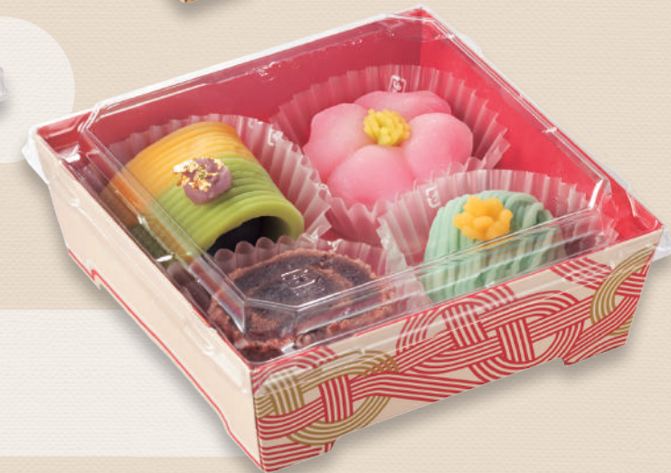
和菓子セット SKS 13-13(43) 赤-水引 / 浅蓋